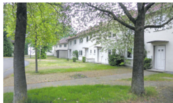
Verlassen: Die Siedlung an der Thomas-Mann-Straße besticht durch ihre gute Lage und erhaltenen Baumbestand.