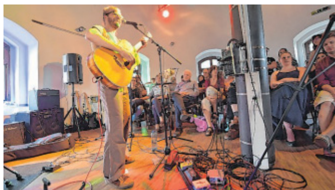
Singer-Songwriter-Pop: Wolf Kluth im Wasserturm.