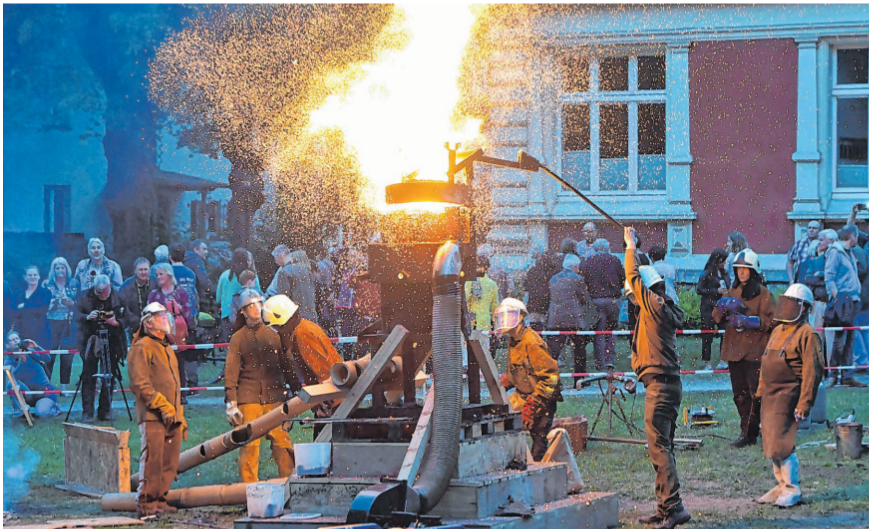
Publikumsattraktion: Vor dem Josefshaus im Webereipark sorgte der „Verein zur Förderung Plastischer Kunst in Stadt und Kreis Gütersloh“ für jede Menge feurige, faszinierende Momente. Bei dieser Performance befüllten die Künstler einen Hochofen mit Gusseisen.

Wie berichtet, befindet sich gut ein Drittel der 1.015 zuvor von den Briten genutzten Wohneinheiten im Eigentum des Bundes. Exakt sind es 370. Laut Herrling könnten in Siedlungen wie an der Thomas-Mann-Straße neue und vor allem bezahlbare Wohnungsangebote für Geringverdiener und Teilzeitbeschäftigte entstehen. Laut dem im vorigen Sommer vorgestellten empirica-Gutachten fehlen in Gütersloh bis 2035 rund 1.000 Einheiten im geförderten Mietwohnungsbau.