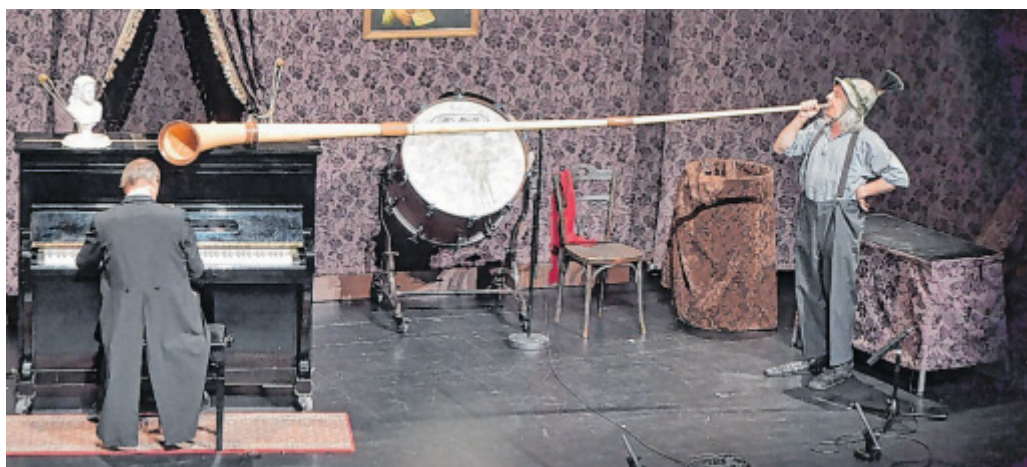
Musikclowns: Die Konzertakrobaten „Gogol & Mäx“ traten zweimal im Saal des Theaters auf. Mit ihren Instrumenten gingen sie rein spaßeshalber robust um.