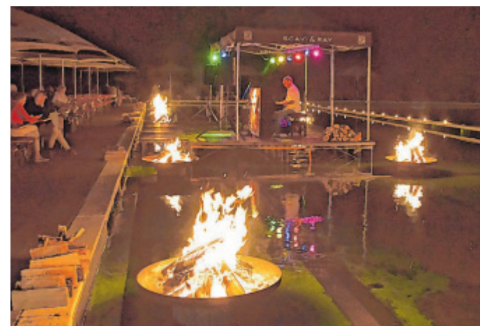
Erstmalig dabei: Im Parkbad spielte Tobias Schössler scheinbar auf dem Wasser schwebend.