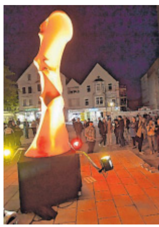
Wie eine Lavalampe: „amorphia“ auf dem Berliner Platz.